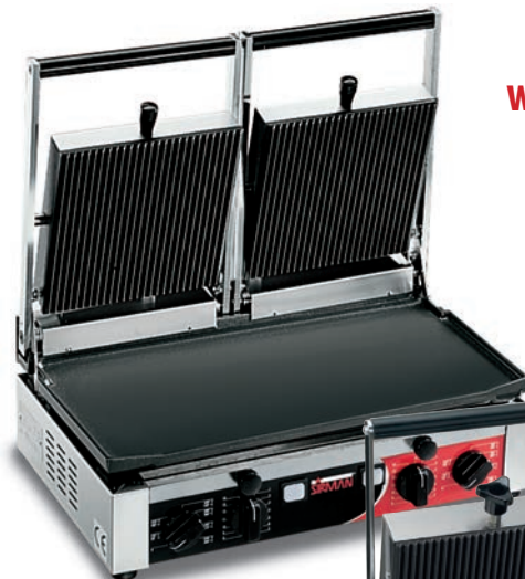
PD LR-LR TIMER