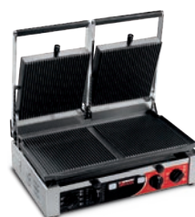
PD RR-RR TIMER