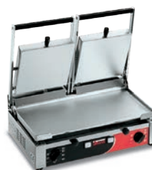
PD XX LL-LL