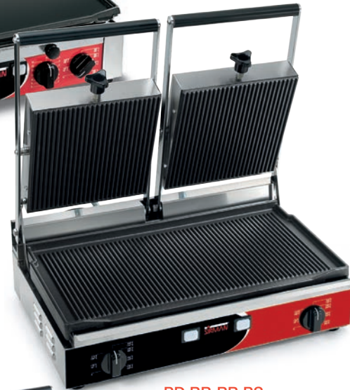
PD RR-RR PS